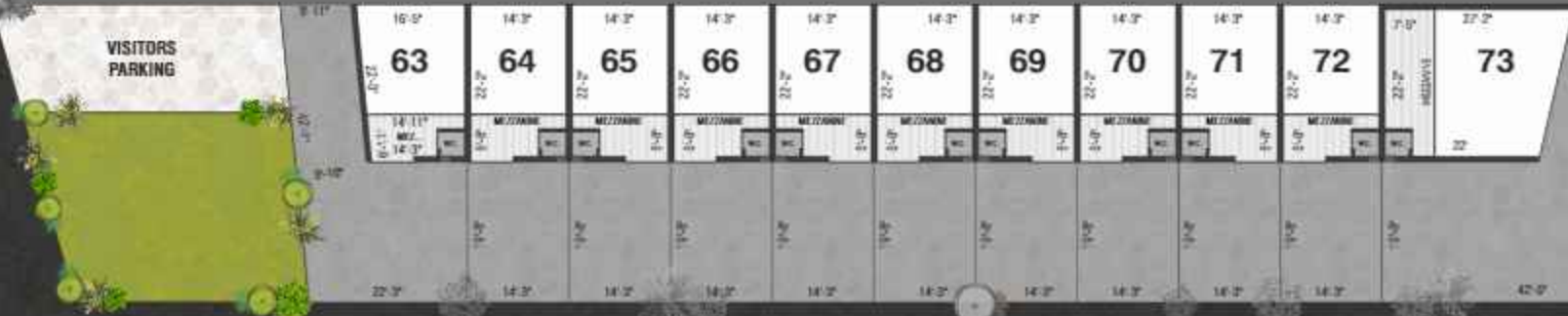
Sample Shed Plan